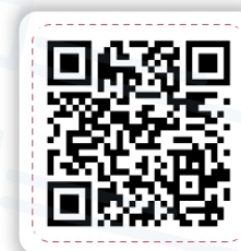
«Твой голос может быть решающим»