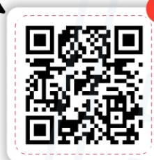
30 лет ЦИК России

Руководит командой которая следит за тем, чтобы выборы проходили честно и справедливо