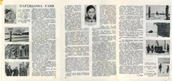
Страна узнала о Зое в начале 1942 года, когда в газете «Правда» был опубликован очерк, который назывался «Таня»

Что двигало Зоей при принятии решения не остаться в тылу, а идти на линию фронта?