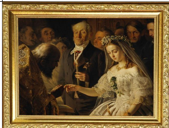
2. В.В. Пукирев «Неравный брак»