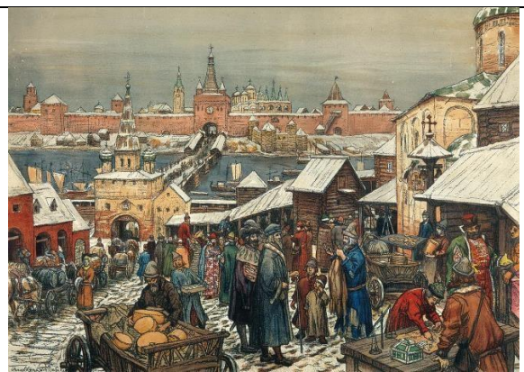
4. А.М. Васнецов «Новгородский торг»