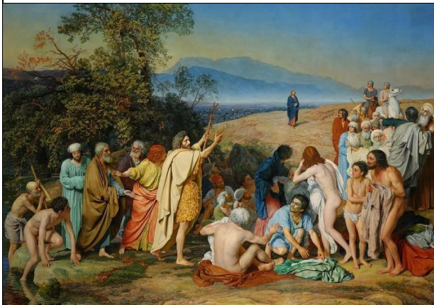
1. А.А. Иванов «Явление Христа народу»