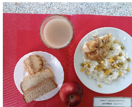
ЗАВТРАК (7-11 лет)